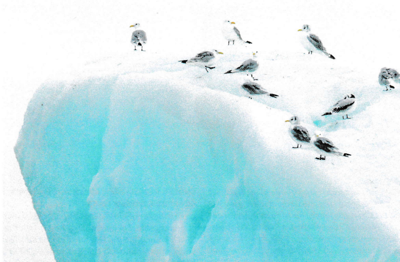
Nordområdene er et utmerket tema for «å holde liv i en rituell og vidløftig svada, fylt av forblommet og avleggs retorikk.» Om det ikke er så fryktelig mye annet å snakke om, kan man alltid legge fram en melding om Nordområdene.

lanserte man uttrykket “Nordkloden” – navnet på den statusrapporten som daværende utenriksminister Børge Brende la frem i november 2014. Dette 71 siders dokumentet måtte nærmest sees som et uttrykk for den nye regjeringens bestrebelse på å utnytte nordområdebegrepet magi, og et ønske om å overta eierskapet til nordområdesatsingen – så å si ta et fast grep om stafettpinnen – men bar ellers ikke bud om en politikk som skilte seg noe særlig fra forgjengernes. For så vidt kunne Nordkloden virke som en støttepasning som regjeringen noe nølende gav seg selv, i påvente av at den kanskje kunne komme opp med noe mer originalt – kanskje endatil komme på offensiven?