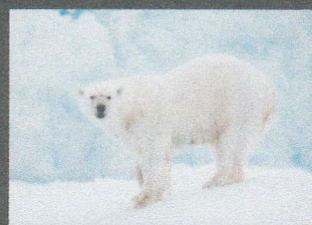
AV ODD GUNNAR SKAGESTAD