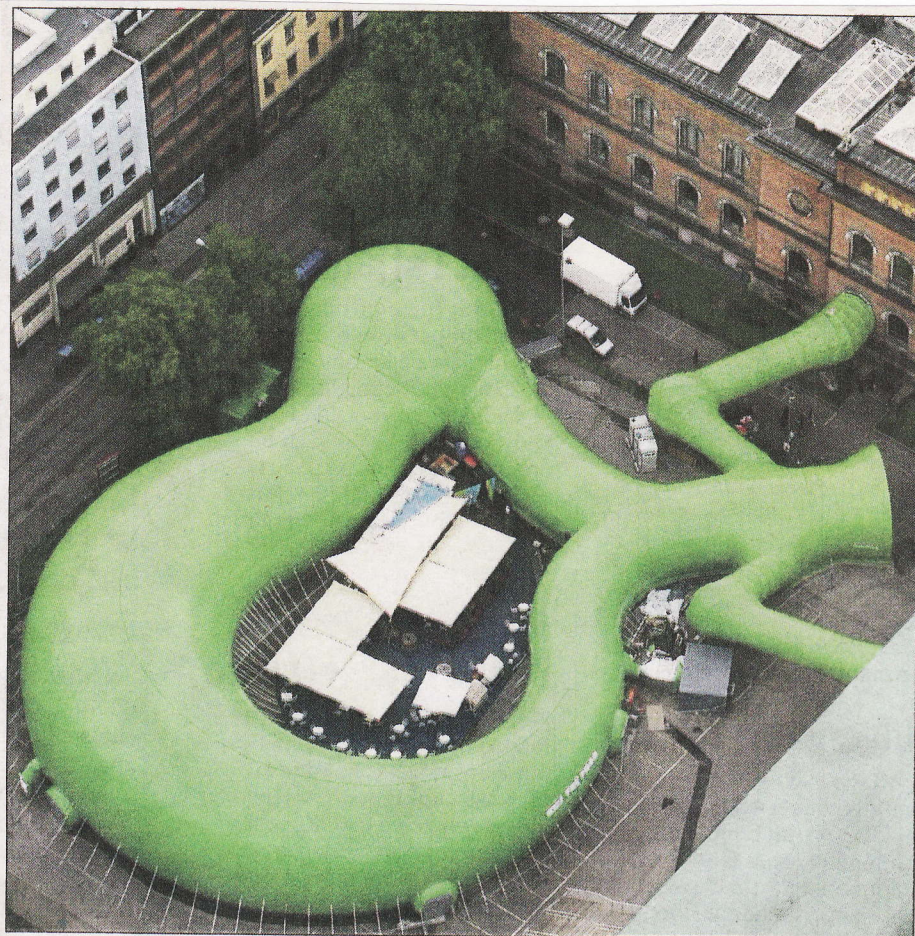
Hele løkka ble i mai 2005 fylt med en oppblåsbar grønn struktur, som ble påstått å ligne en frosk, og som sommeren igjennom ble åsted for utstillingen «Kys Frosken. Forvandlingens kunst», skriver Odd Gunnar Skagestad.