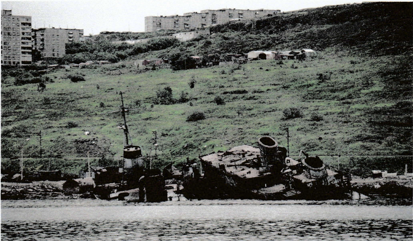
Det hersker selvfølgelig liten tvil om at styrkeforholdet i Europa er endret de siste 30 år. Men konkret hva som er endret forsvinner ofte i debatten. Foto er fra den russiske flåtes base i Severomorsk på 1990-tallet.