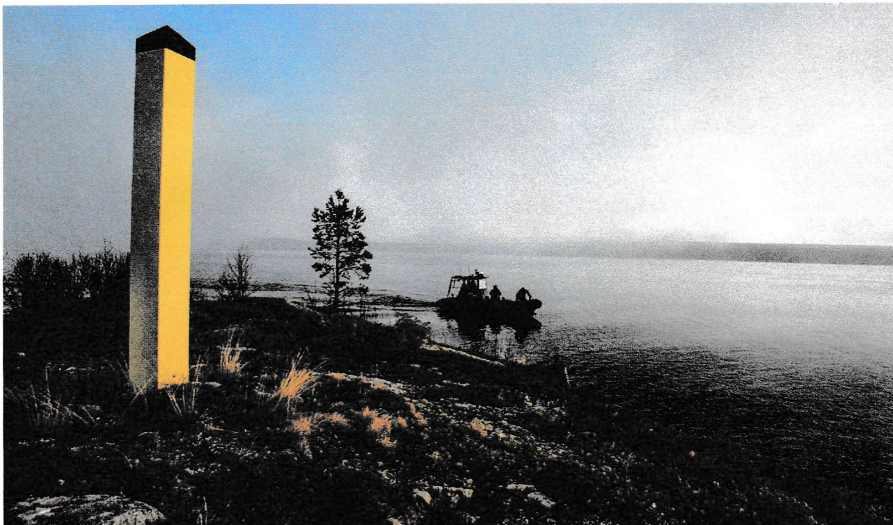
Russland vil kunne oppvise en betydelig lokal overvekt i enhver konfrontasjon med NATO langs landets egne vestgrenser. Fotografiet viser en båtpatrulje fra GSV som patruljerer elven på grensa mellom Norge og Russland.