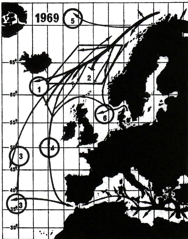
1) Vårmanøveren 1969 begynte i området mellom Island og Færøyene med et stort antall skip. 2) og 3): Øvelsene omfattet den første betydelige forsterkning av Middelhavsstyrker fra Nordflåten, hvorefter en styrke besøkte det Karibiske hav. 4) En ny forsterkning av Middelhavsflåten fra Nord i september og oktober. 5) og 6): Andre manøvrer i områdene.

(—«Nato Letter» sept. 1970. «Special Naval Issue».)