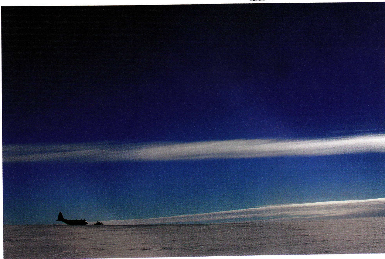
ET STYKKE NORGE LANGT HJEMMEFRA: Et av Forsvarets C 130 Hercules fly på isen i Dronning Maud land.

skriv fra det britiske landbruksministerium 18. mai 1908. Det lyktes imidlertid ikke Norge å oppnå øvrige lempelser i de britiske konsesjonsvilkårene for hvalfangsten i denne del av Syd-Ishavet.