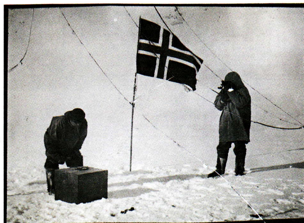
NORSK ISHAVSIMPERIALISME: Roald Amundsen og Helmer Hanssen på Sydpolen, desember 1911.

Regjeringen hadde gitt "Norvegia"-ekspedisjonen en generell fullmakt til under sitt tokt 1929-30 å ta i besittelse i H.M. Kong Haakon VII's navn nytt land som måtte påtreffes og som ikke tidligere var blitt okkupert av noe annet lands regjering. Det var samtidig en klar forutsetning at det ikke skulle okkuperes land