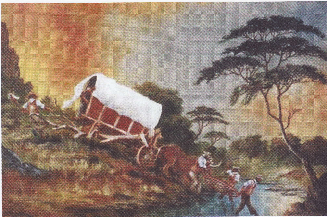
The Great Trek

omfattende bølge av massedrap på Frankrikes hugenotter.