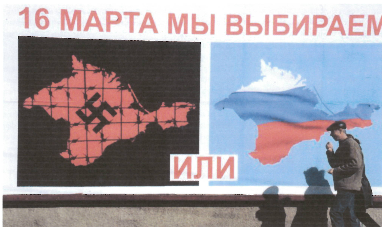
Propaganda trenger ikke å være spesielt sofistisert for å få effekt. Det var ikke tvil om hva Krims innbyggere ble bedt om å ta stilling til under folkeavstemningen 16. mars 2014.