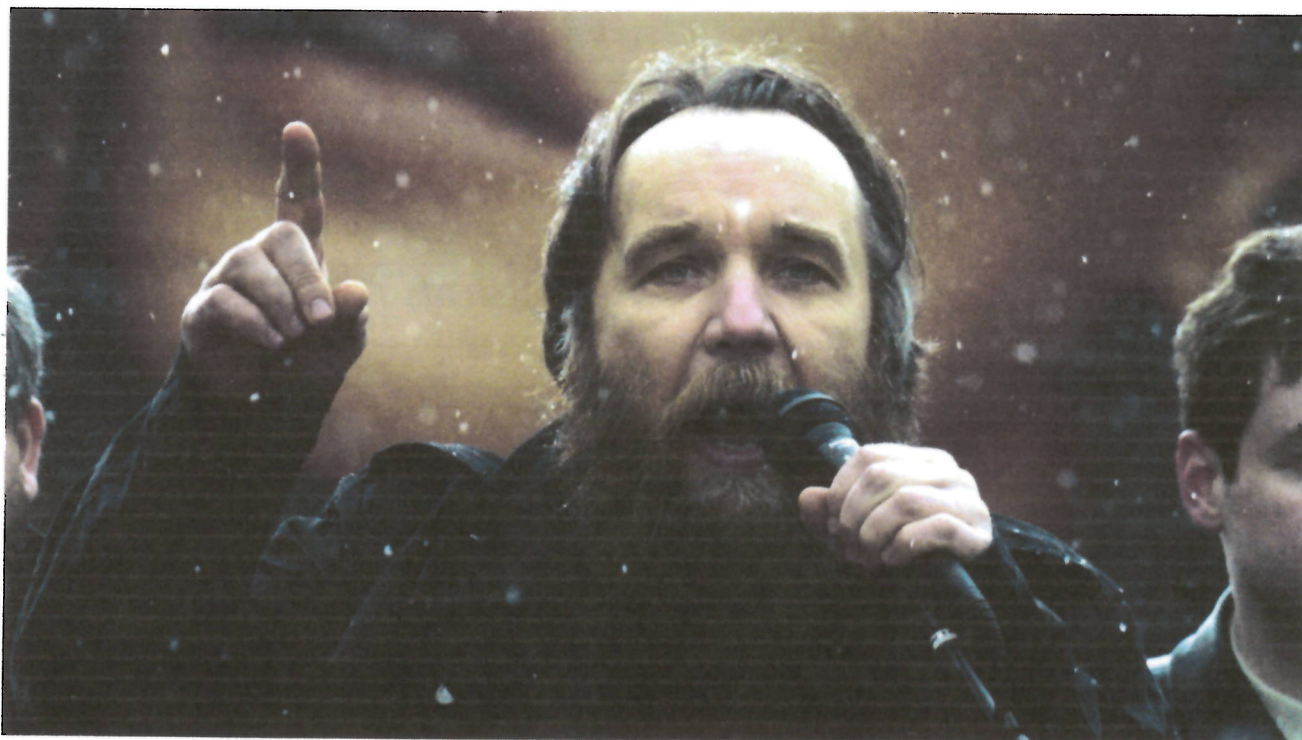
Geopolitikeren Aleksandr Dugin betegnes ofte som hjernen bak Putins anneksjon av Krim.

Å tro at man kan "lese" en person ved å tolke vedkommendes såkalte "kroppsspråk" vil som regel bære galt av sted. Det kan likevel være interessant å observere og gjøre seg enkelte betraktninger omkring en persons væremåte og fremtreden. Etter å ha tilbrakt til sammen syv år av mitt liv i offisielt ærend i Russland og den fordums Sovjetunionen har undertegnede møtt et utall russiske myndighetspersoner, og hatt anledning til på nært hold å iakttå et mangfold av karakteristiske væremåter – det være seg joviale, temperamentsfulle, hånlige, brautende, truende, innsmigrende, flåsete, intense, påtatt elskverdige, uoppmerksomme, bombastiske, sjarmerende, nedlatende, spøkefulle eller gretne.