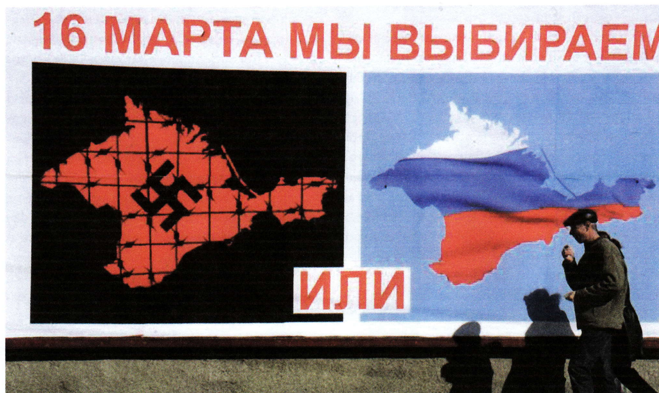
Propaganda trenger ikke å være spesielt sofistikert for å få effekt. Det var ikke tvil om hva Krim's innbyggere ble bedt om å ta stilling til under folkeavstemningen 16. mars 2014.