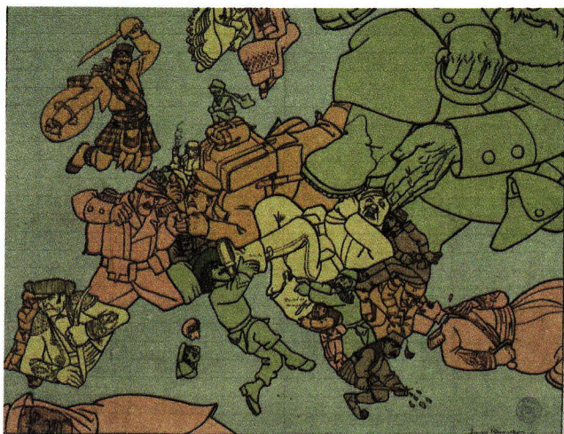
I klassisk statsvitenskapelig begrepsbruk er 'geopolitikk' betegnelsen på en kvasi-vitenskapelig ideologi som ble utviklet på slutten av 1800-tallet og tidlig 1900-tall, med det formål å legitimere territoriale utvidelser på andre staters bekostning.