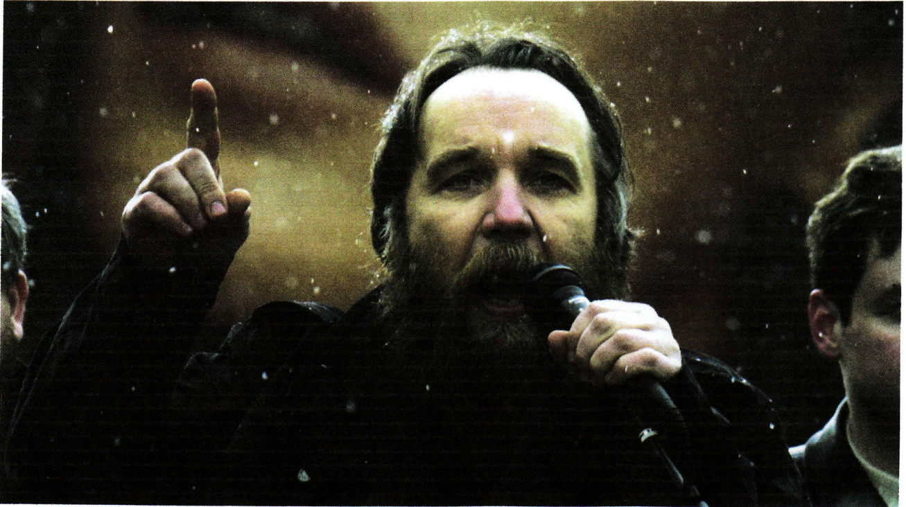
Geopolitikeren Aleksandr Dugin betegnes ofte som hjernen bak Putins anneksjon av Krim.

Å tro at man kan "lese" en person ved å tolke vedkommendes såkalte "kroppsspråk" vil som regel bære galt av sted. Det kan likevel være interessant å observere og gjøre seg enkelte betraktninger omkring en persons væremåte og fremtreden. Etter å ha tilbrakt til sammen syv år av mitt liv i offisielt ærend i Russland og den fordums Sovjetunionen har undertegnede møtt et utall russiske myndighetspersoner, og hatt anledning til på nært hold å iakttå et mangfold av karakteristiske væremåter – det være seg joviale, temperamentsfulle, hånlige, brautende, truende, innsmigrende, flåsete, intense, påtatt elskverdige, uoppmerksomme, bombastiske, sjarmerende, nedlatende, spøkefulle eller gretne.