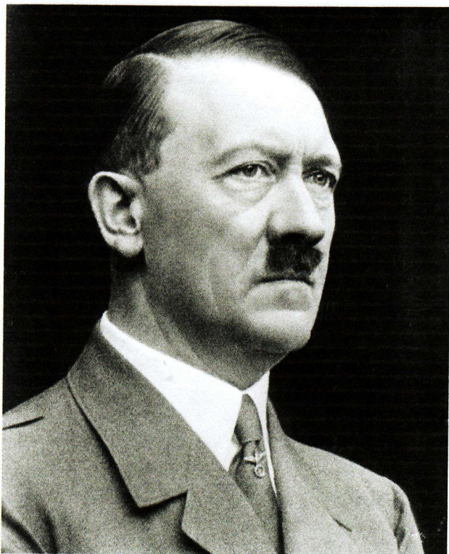
Man tyr ofte til historiske analogier for å beskrive vår egen tid. Men hvilke krav bør vi stille til slike paralleller?

sin ved årsskiftet 1999-2000 brått annonserte at han gikk av som president, stod statsminister Putin klar til å overta, og han skulle siden den gang komme til å dominere russisk politikk – med tiden med stadig sterkere preg av å være Russlands enehersker.