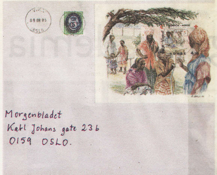
Unik fellesutgivelse: Den 8. mai 1987 utstedte Norge og Somalia et felles frimerke, med samme gyldighet i begge land.

En stats fornemste visittkort er frimerket . Helt siden det første frimerket (det britiske «One Penny Black») så dagens lys 6. mai 1840, har frimerkeutgivelser vært allment ansett som et statlig prerogativ. Frimerket er et