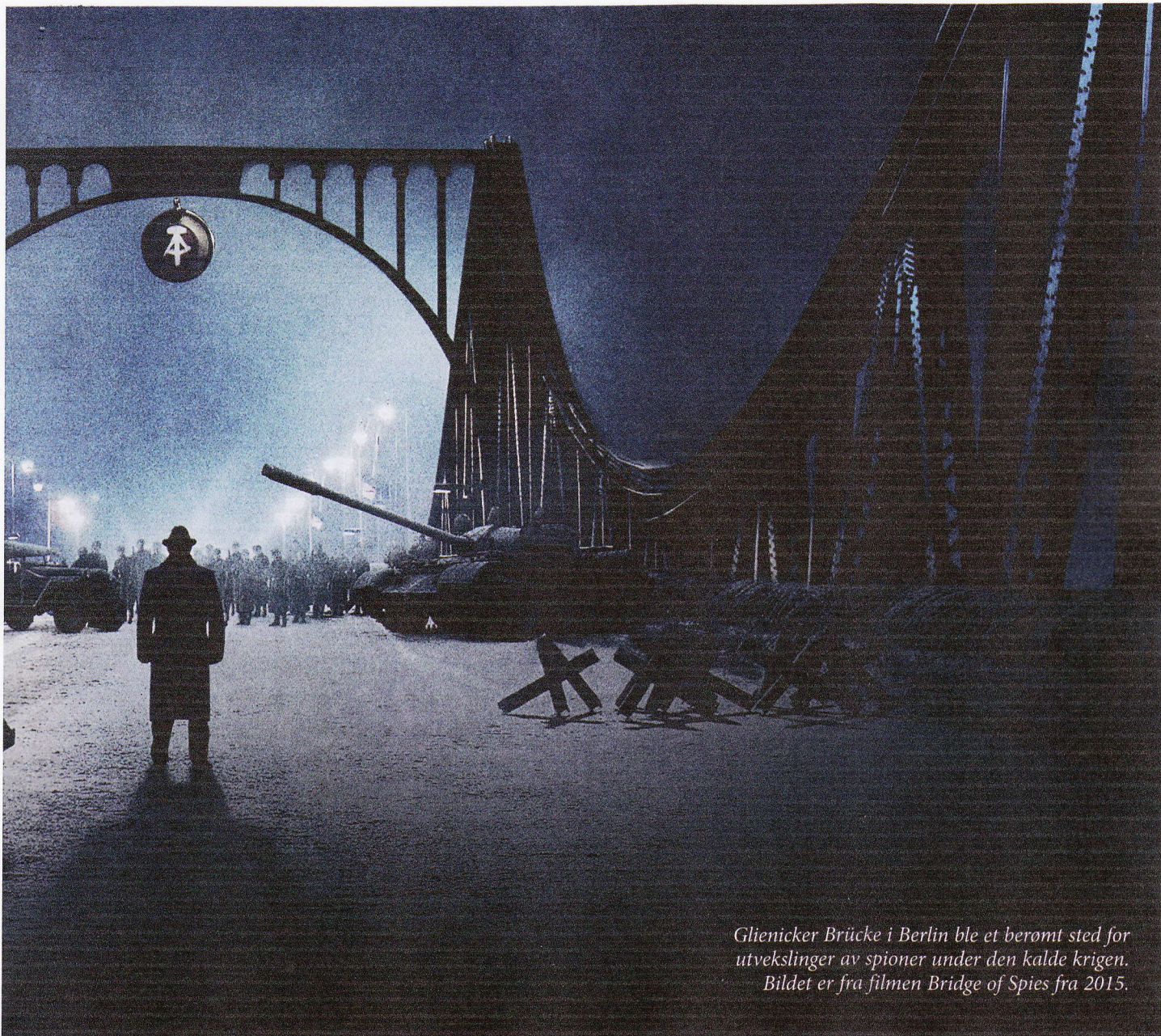
Glienicker Brücke i Berlin ble et berømt sted for utvekslinger av spioner under den kalde krigen. Bildet er fra filmen Bridge of Spies fra 2015.

lyktes det Norge Eksportråd å skaffe en etterfølger i stillingen, hvorefter en normalsituasjon kunne gjenoprettes.