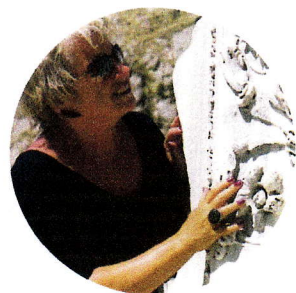
Bare se, ikke røre?

Levende Historie skuffer som regel ikke, men bruker å gi en leseropplevelse som inspirerer til mer lesning. Nr. 3, 2005 skuf-