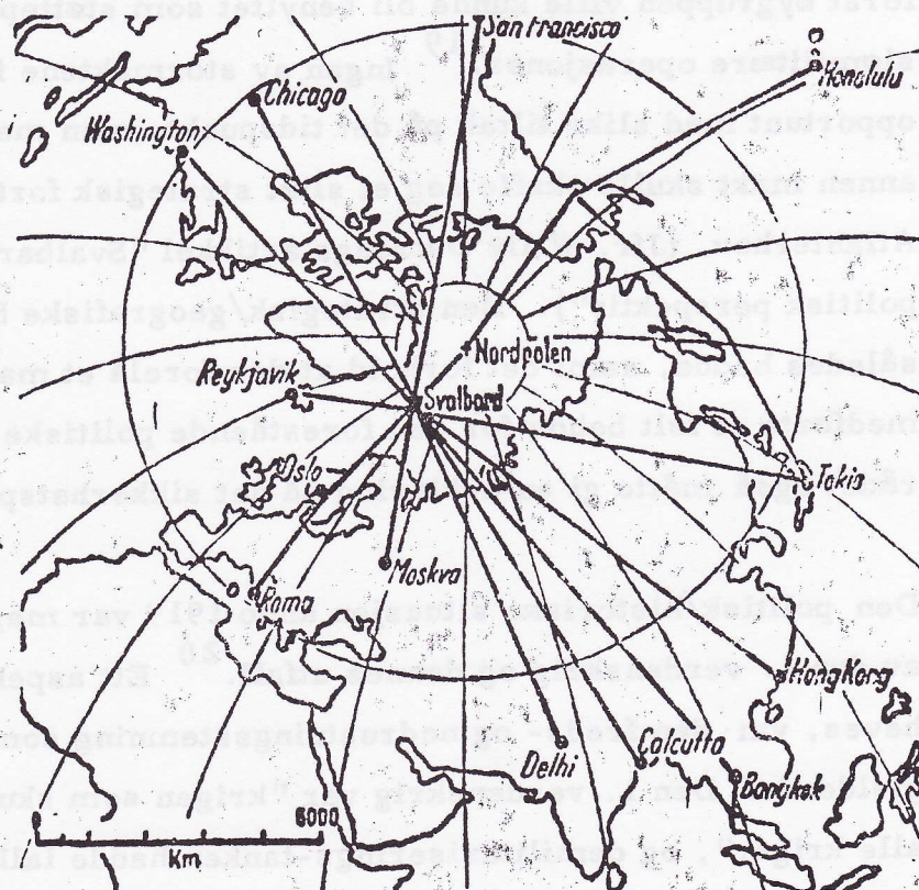
Svalbard, som luftgeografisk sentrum for flytrafikken mellom kontinentene.

Idag er det en hevdvunnen oppfatning at Svalbards beliggenhet gjør øygruppen til et strategisk sensitivt område. Dette er i adskillig grad en følge av de teknologiske landevinninger (ikke minst m.h.t. luft- og rakettstrategi), som har vært gjort de siste 3-4 desennier. Betrakter man en