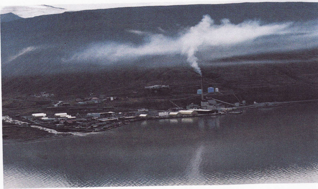
Longyearbyen FMS ved Erik Skjeve.

grensen”) med sammenhengende permafrost samt havstrekninger nord for den sydlige grense for maksimum utbredelse av hav-is. En annen, nokså nært sammenfallende definisjon omfatter alle områder på den nordlige halvkule nord for en linje på kartet som fremviser en middeltemperatur for juli måned på +10^{\circ}\text{C} . redusert til havoverflaten (juli-isoterme på +10^{\circ}\text{C} .) – en meget uregelmessig linje som avviker sterkt fra den jevne og formfullendte Polarsirkelen.