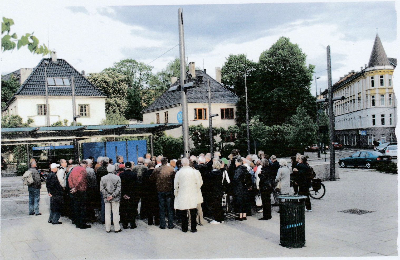
Frogner plass og den ovale rundkjøringen. På fotoet ser vi tilbake på en av Oslo Byes Vels mange byvandringar her ved Lars Roede i mai 2009.

utskilt fra Frogner Hovedgård. Denne løkken utgjorde de østlige og sydlige delene av det nåværende kvartalet, samt noe av grunnen videre på sydøstsiden av Nordraaks gate. Siden løkken danner et høydedrag i terrenget, gav sorenskriveren sin nyervervede eiendom navnet Frognerhøy. Den gamle ferdselsveien gjennom kvartalet fikk derfor navnet Frognerhøyveien, men i forbindelse med utbyggingen av kvartalet i 1890-årene ble den regulert bort, og noen synlige spor etter denne veistubben eksisterer knapt lenger.