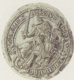
Seglet til Audun Hugeliksson (ca. 1240 - 1302)

OBSERVANTE KOLLEGER vil ha registrert at det i løpet av fjoråret dukket opp en skulptur nær hovedinngangen til Nordkvartalet (rett utenfor vinduene til vårt nå henfarnede bibliotek, ja...). En skulptur til ære for Jørgen Løvland, som utvilsomt fortjente et minnesmerke. Med inskripsjonen «Norges første utenriksminister» er dette minnesmerket samtidig et monument over vår historieløshet: Et éntydig budskap om at Norgeshistorien begynte i 1905, en påminnelse – hugget i sten – om vår manglende vilje eller evne til å ta inn over oss den forestilling at Fedrelandet kunne ha hatt noen utenrikspolitikk – ennsi noen utenriksminister – før den tid.