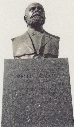
Et minne over vår historieløshet?

råvarer for «sjømakten» var i seilskutetiden såkalte «naval stores» – mastetømmer, tjære og hamp som behøvdes for orlogslåten. Dette var råvarer som måtte importeres fra Norden, Østersjø-landene og Russland, og som betydde avhengighet av importveien via Øresund/Storebælt. Og Englands økende sårbarhet overfor hindringer av landets eksport av ferdigvarer ble demonstrert under Napoleonskrigene, da Frankrikes blokadepolitikk var nær ved å knekke «sjømaktens» finansielle rygggrad.