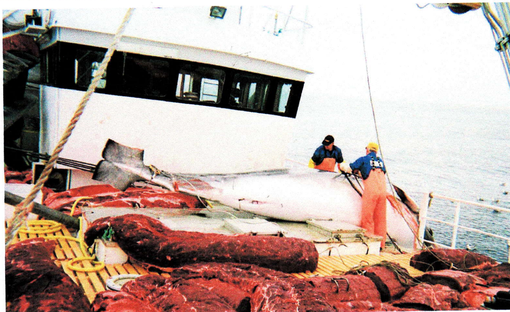
HVALFANGST: Et særlig problem for Norge er at CITES siden 1983 har gjort gjeldende totalforbud mot handel (Liste I) for de to nordatlantiske bestandene av vågehval som Norge fangster på.

Hovedinnlegg/kronikk: Maksimalt 5.000 tegn (ca. 750 ord). Underinnlegg/replikk: Maksimalt 1.500 tegn (ca. 250 ord). Fiskeribladet forbeholder seg retten til å forkorte alle innlegg som mottas. Likeledes forbeholder vi oss retten til å lagre innlegg i elektronisk form, samt publisere dem på internettet. Innlegg honoreres ikke.