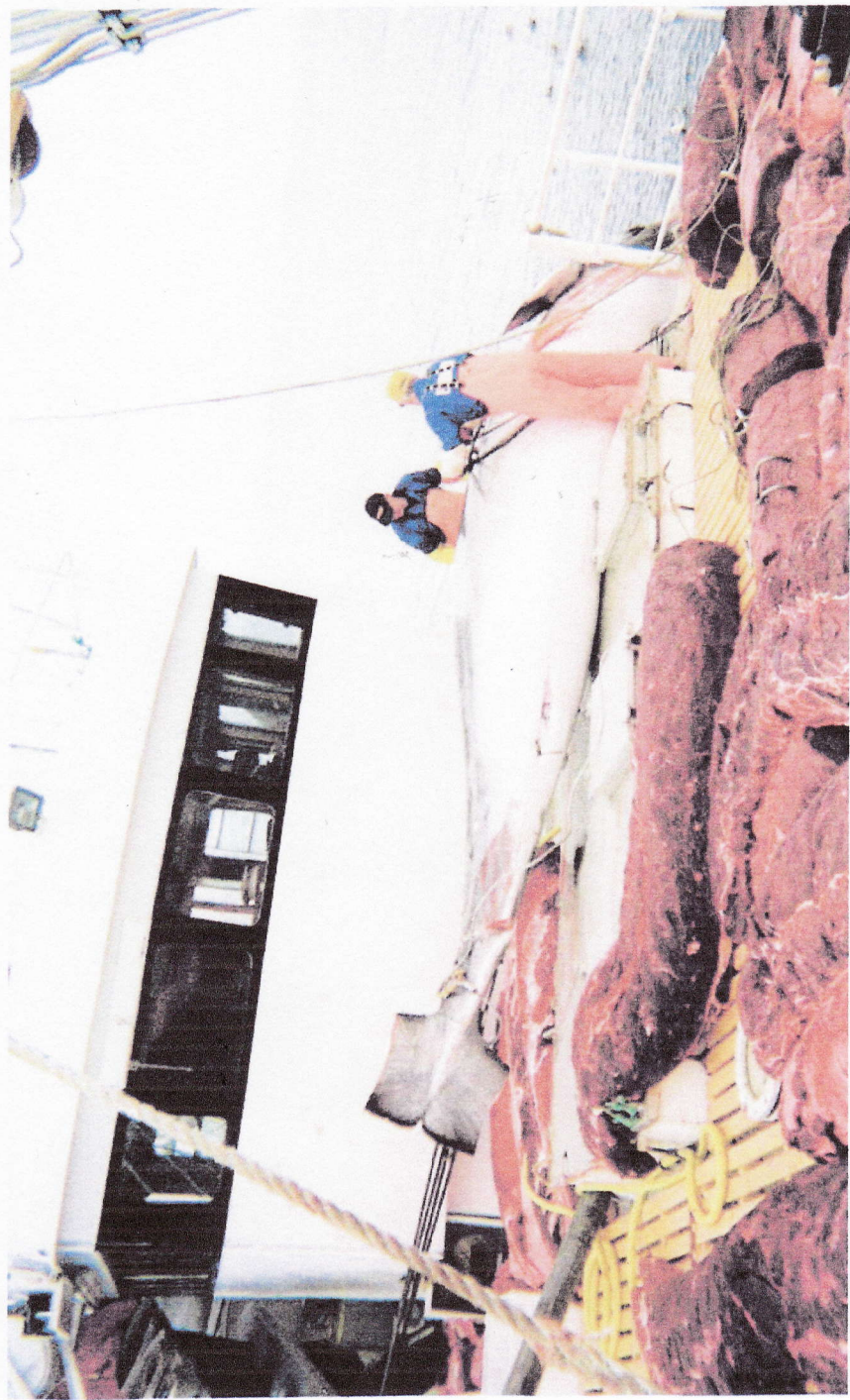
HVALFANGST: Et særlig problem for Norge er at CITES siden 1983 har gjort gjeldende totalforbud mot handel (Liste I) for de to nordatlantiske bestandene av vågehval som Norge fangster på.

Hovedinnlegg/kronikk: Maksimalt 5.000 tegn (ca. 750 ord). Underinnlegg/replikk: Maksimalt 1.500 tegn (ca. 250 ord). Fiskeribladet forbeholder seg retten til å forkorte alle innlegg som mottas. Likeledes forbeholder vi oss retten til å lagre innlegg i elektronisk form, samt publisere dem på internettet. Innlegg honoreres ikke.