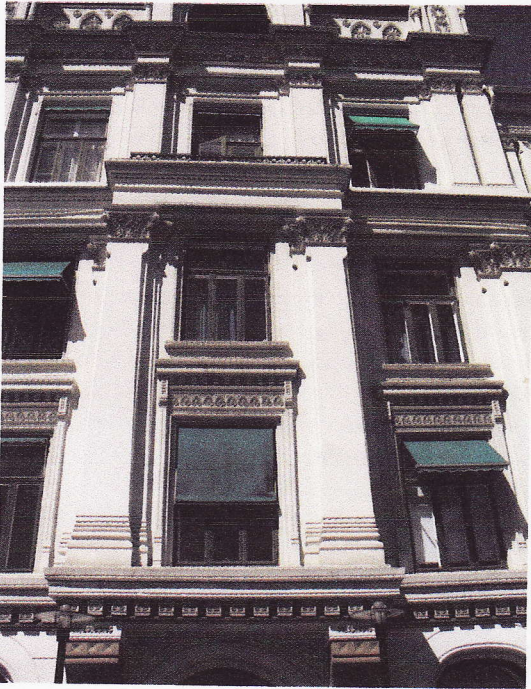
karnapper, søyler og pilastre utstyrt med korintiske kapiteler