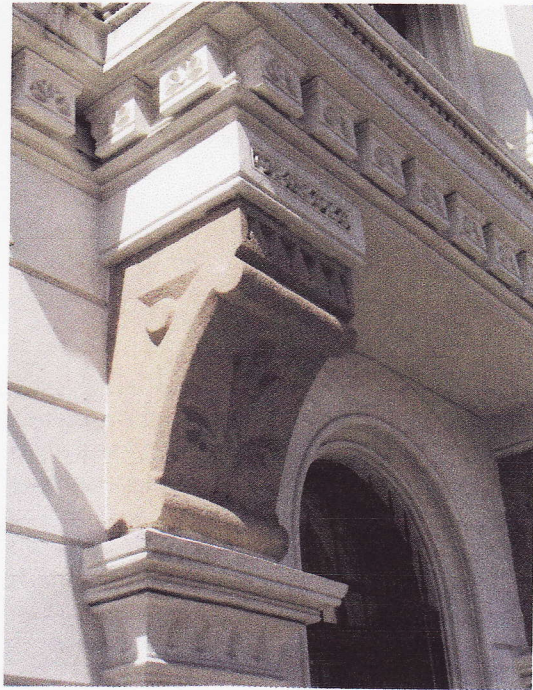
fremspringende knekter i gedigen rod granitt

videre oppover i spredt orden en arrogant kolleksjon triumferende tårn og himmelstrebende spir, og på toppen av det hele, en veldig kuppel som hever seg freidig over det midtre kvartal. Et festlig skue i grunnen, i alle fall på en godværsdag, når de allerede velbeslåtte frontfasadene forsterkes med struttende grønne markiser i endeløse rekker og geledder.