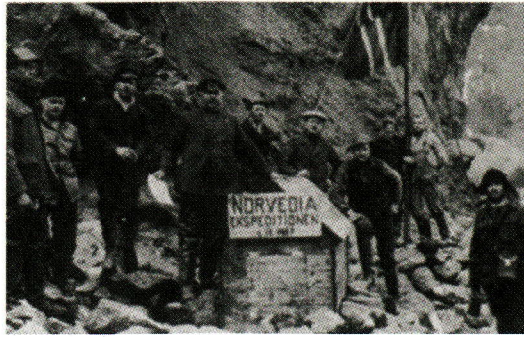
Norvegia -ekspedisjonen i 1927 la grunnlaget for Bouvetøyas status som norsk «biland» i 1930.

I tillegg til omsorgen for hvalfangstnæringen var trolig den innenrikspolitiske situasjon utslagsgivende for regjeringens opptreden. Ivar Lykke (H) var på denne tid stats- og utenriksminister, og hans utenrikspolitikk var sterkt påvirket av formannen i Stortingets utenrikskomité, Carl Joachim Hambro. Regjeringen Lykke gikk av 28. januar, og etter to ukers mellomspill med Christopher Hornsrud (Ap) som statsminister overtok