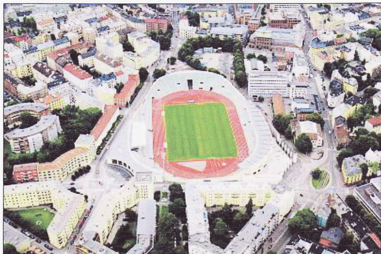
Innsenderen foreslår at rundkjøringen nede til høyre på bildet får navnet Undis Blikkens plass .