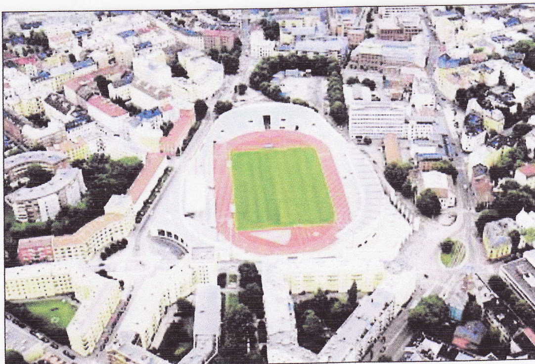
Innsenderen foreslår at rundkjøringen nede til høyre på bildet får navnet Undis Blikkens plass.