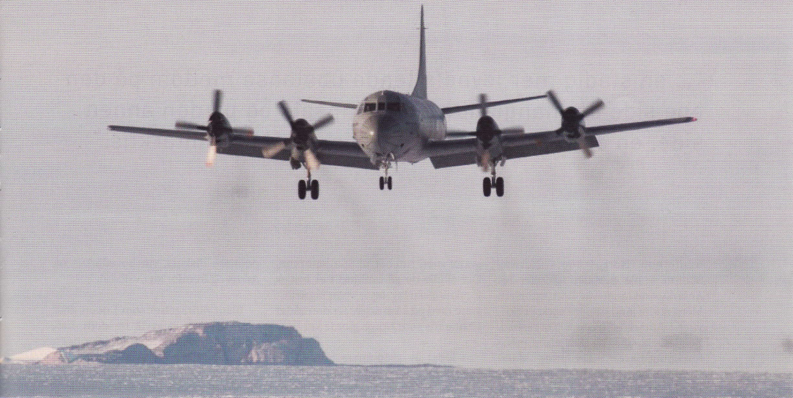
Norsk P-3C Orion på oppdrag ved Trollbasen.

Traktaten hadde riktignok ikke gitt kravshaverne noen nettogevinst. Ikke en tøndel i traktaten gav dem noen styrkelse av kravene. Men de hadde heller ikke måttet tåle noe netto tap, og hva bedre var: Traktaten innebar – iallfall på papiret – en garanti mot eventuelle senere svekkelser av kravene. Status quo var sikret, og kravshaverne behøvde ikke gjøre det skapte grunn for å opprettholde sin stilling i Antarktis, med de streker og de navn som de hadde rukket å tegne inn på kartet.