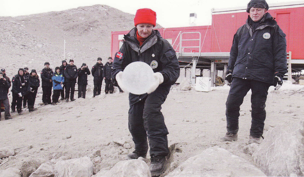
12. februar 2005 foretok H.M. Dronning Sonja den offisielle åpningen av den norske forskningsstasjonen Troll: Norges første helårs forskningsstasjon i Antarktis på 45 år.