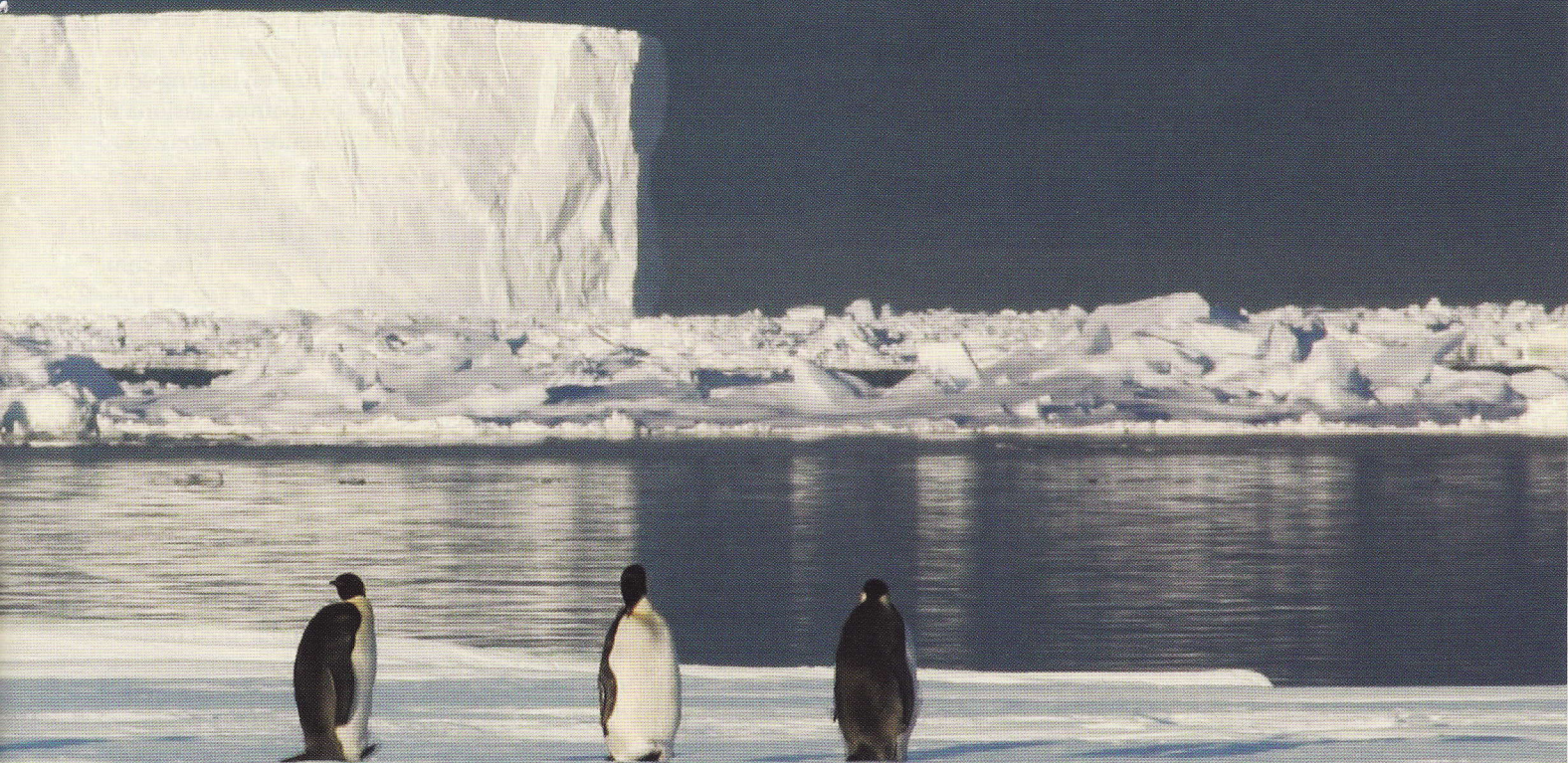
Fastboende fotografert av 333 skvadronen.

gitt sterke føringer om et omfattende internasjonalt forsknings samarbeid. At vi nå har rundet femtiårsmerket kan være en passende foranledning til å stanse opp og stille spørsmål om den betydning Antarktistraktaten kan ha hatt for norsk politikk gjennom denne tidsepoken.