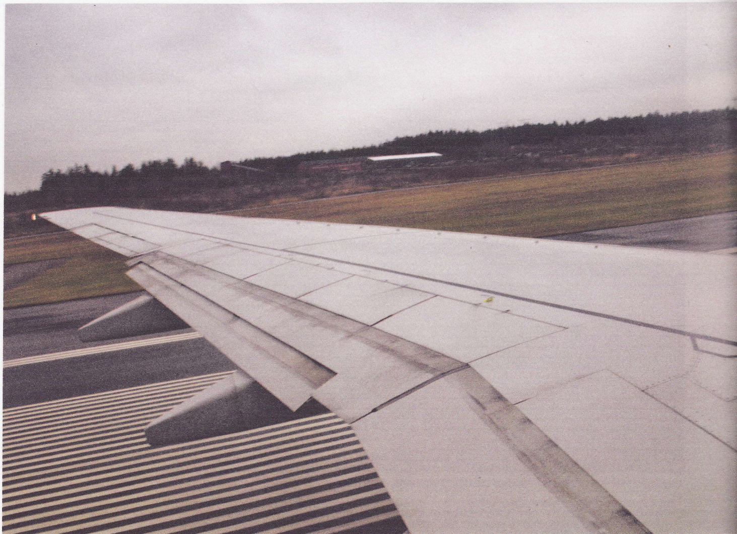
Utsikt Arlanda/ Stockholm - St. Petersburg 06.11.2009.

tekstdelane sett saman av parallelle bolkar på engelsk og heimlandet sitt språk, som i dette høvet følgjeleg er norsk. Engelsken er som ein kunne venta seg, norsken er jamnt over prega av ein påfallande bruk av a-endingar, lik det ein i gamle dagar kalla ”bokmål, radikale former” (døme toalettveska, sju, sola, tjue, tida, popgruppa, senga, flyvertinna, ruta, veska, husleia, kneipa, bobla, lista, ruta, dyra, stranda, partydronninga osv). Slike bøygningsformer – som elles helst høyrer heime i nynorsk-tekster – læt mest som knot i bokmål-tekster av dei slaga som me finn her. Dette vil nok i sær riksmålsfolket lika dårleg, men truleg andre óg (dette har rett og slett noko med stil å gjera).